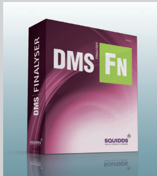
Finalyser DMS / CMS

Vorteil: Der spätere Wechsel zu anderen Einzelkomponenten oder die Erweiterung um Zusatzfeatures ist ohne weiteres möglich. Damit bietet Finalyser DMS/CMS dem Nutzer einzigartige Investitions- und Zukunftssicherheit zu einem besonders günstigen Preis.