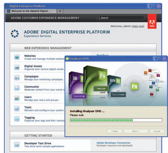
Jetzt auch „ready for“ Adobe's Digital Enterprise Platform

Nicht nur in der Technischen Dokumentation geht der Trend mehr und mehr hin zur Publikation von Inhalten via Internet. Content soll bei Bedarf überall und zu jeder Zeit verfügbar sein. Adobe trägt dieser Entwicklung mit der neuen Digital Enterprise Platform (früher Adobe LifeCycle® und CRX) Rechnung, die den Dialog zwischen Unternehmen und ihren Kunden über alle Kommunikationskanäle vereinfachen soll. Ganz bewusst bezieht die Adobe-Lösung das World Wide Web und internetfähige Smartphones mit ein – ein Weg, den auch SQUIDDS, die Nürnberger Spezialisten für Workflow-Optimierung in der Technischen Dokumentation, schon seit Längerem konsequent verfolgen.